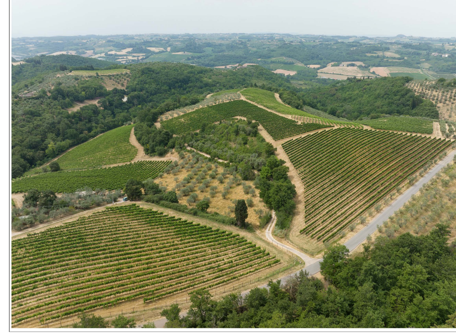
FOTO PANORAMICA DA NORD-EST