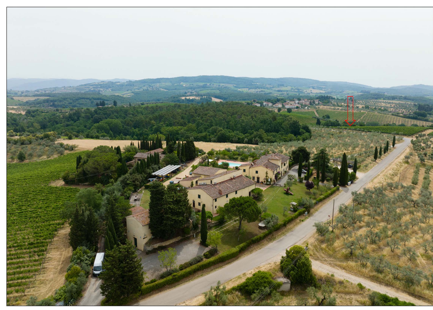
FOTO PANORAMICA DAL TORRIANO