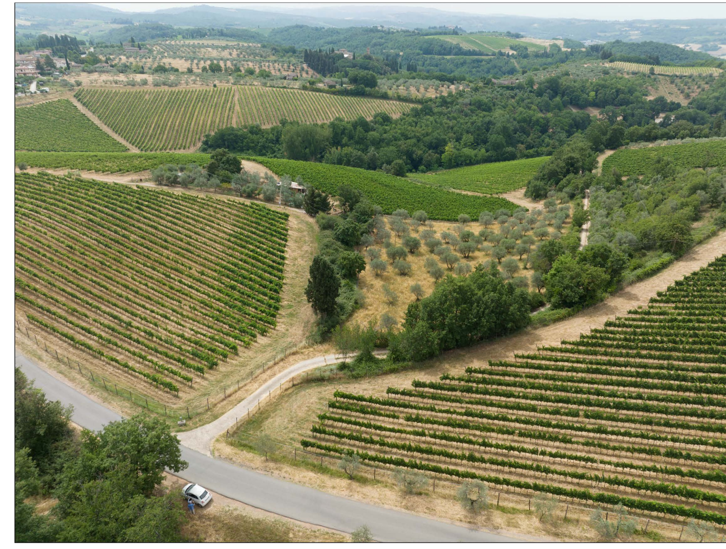
FOTO PANORAMICA DA NORD-OVEST