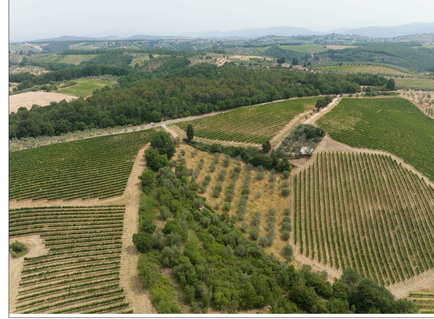
FOTO PANORAMICA DA SUD-OVEST