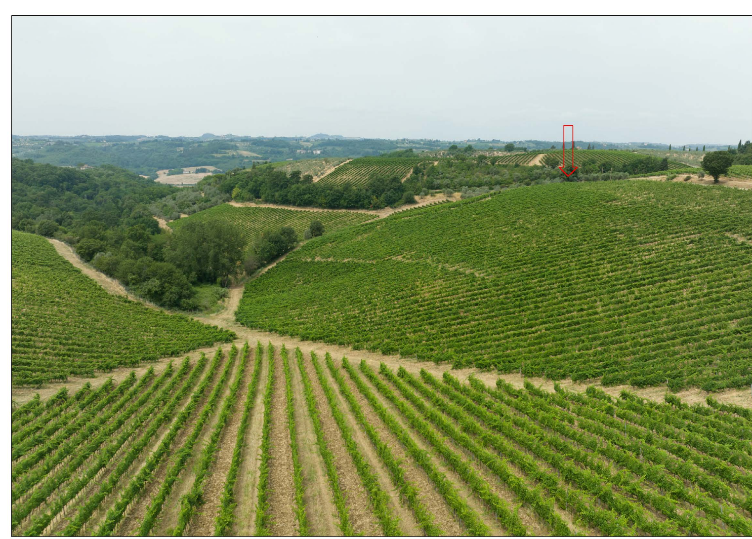
FOTO PANORAMICA DA MONTEFIRIDOLFI