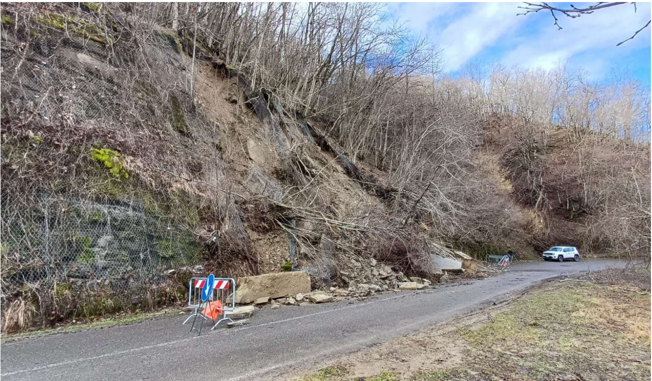
Figura 3 SP 74 Km 12+400 frana di monte