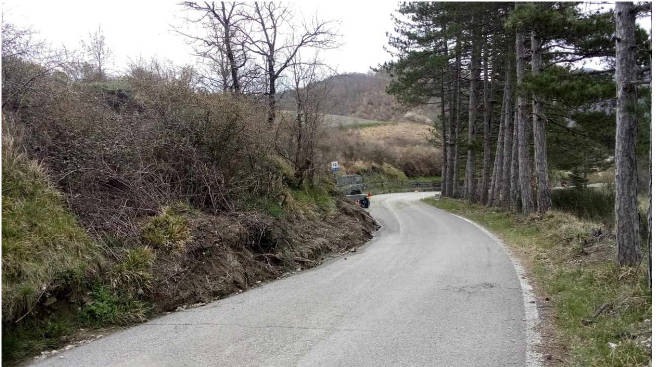
Foto 1: SP 117 frana di monte con presenza di materiale in strada