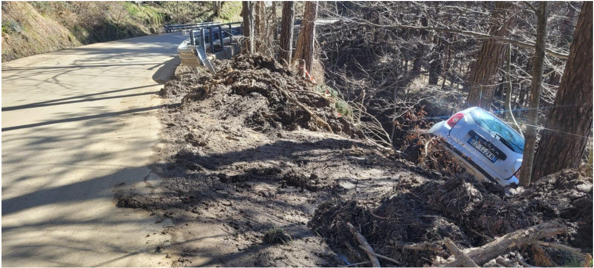
Figura 2 SR 302 km 47+200 frana di valle