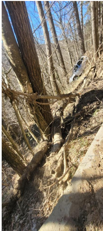
Figura 3 SR 302 km 47+200 frana di valle