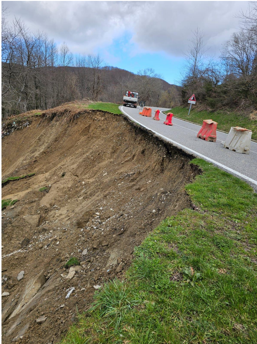
Figura 3 SP 477 Km 12+600 frana di valle