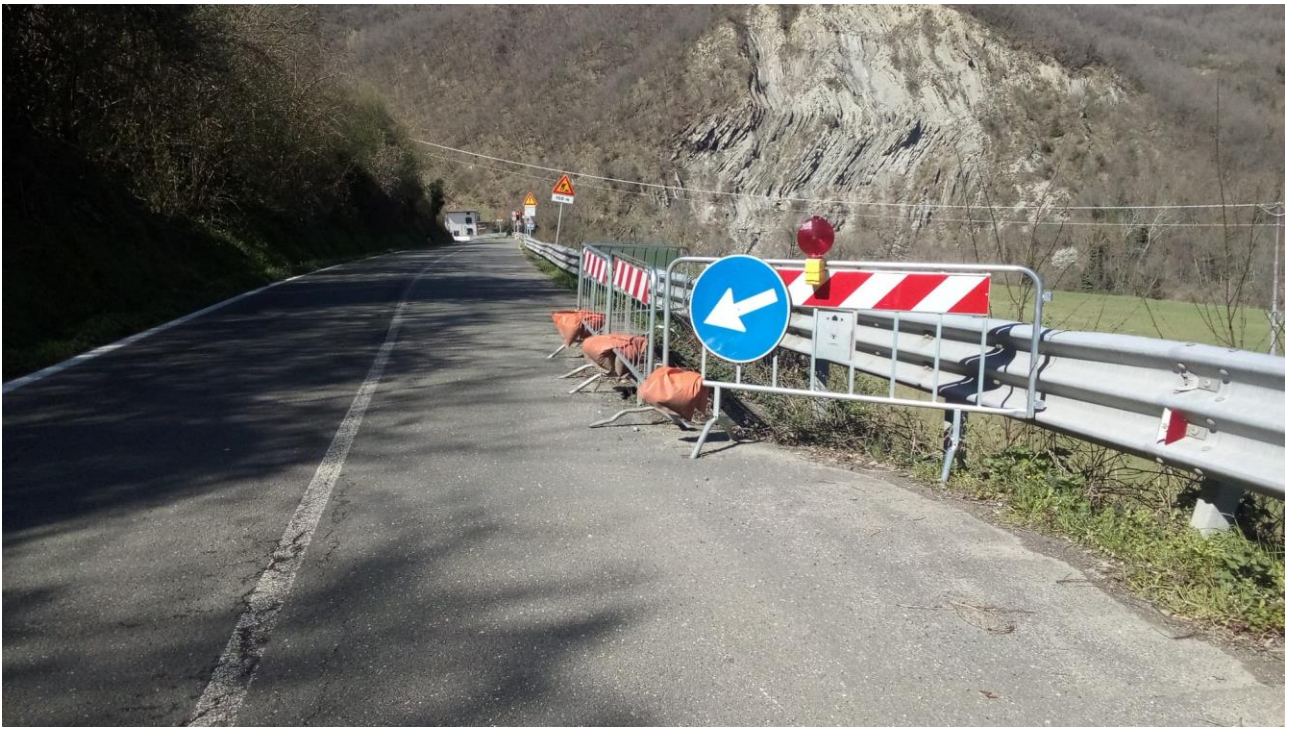
Foto 3: SP 610 km 64+800 frana di valle con danneggiamento della sede stradale