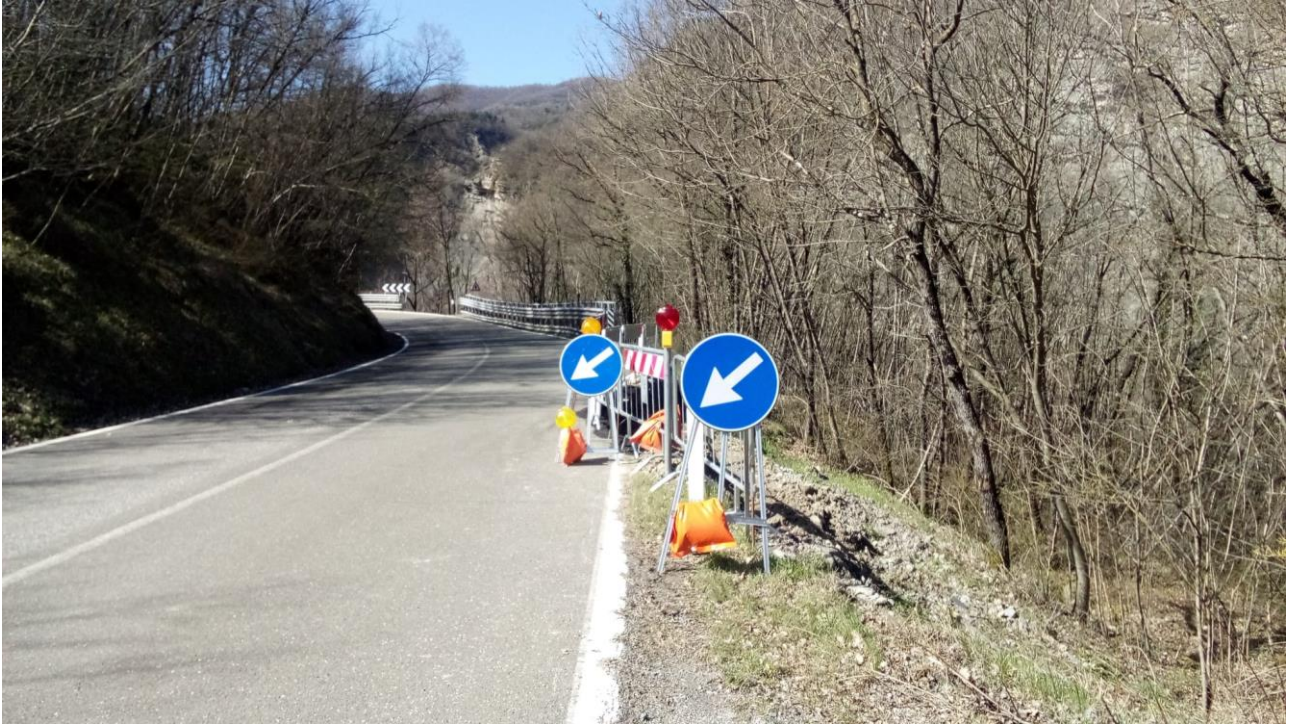
Foto 1: SP 610 km 63+800 frana di valle con danneggiamento della sede stradale