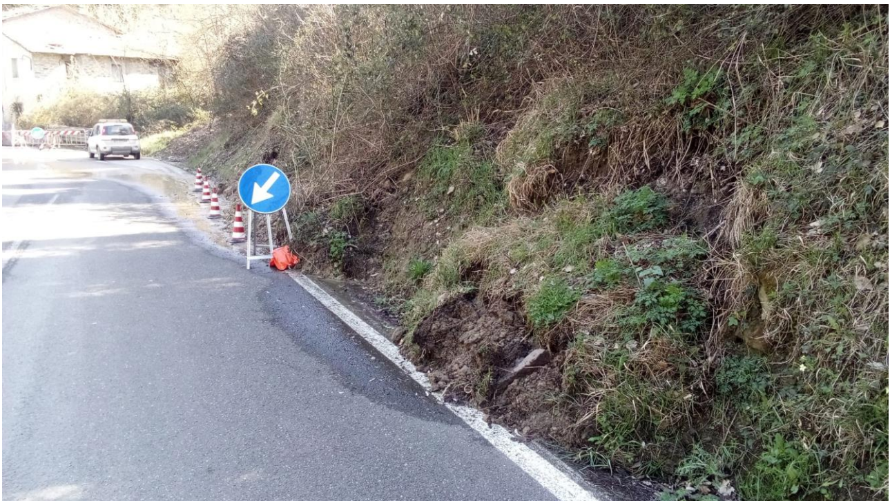
Foto 4: SP 610 km 66+200 frana di valle con danneggiamento della sede stradale