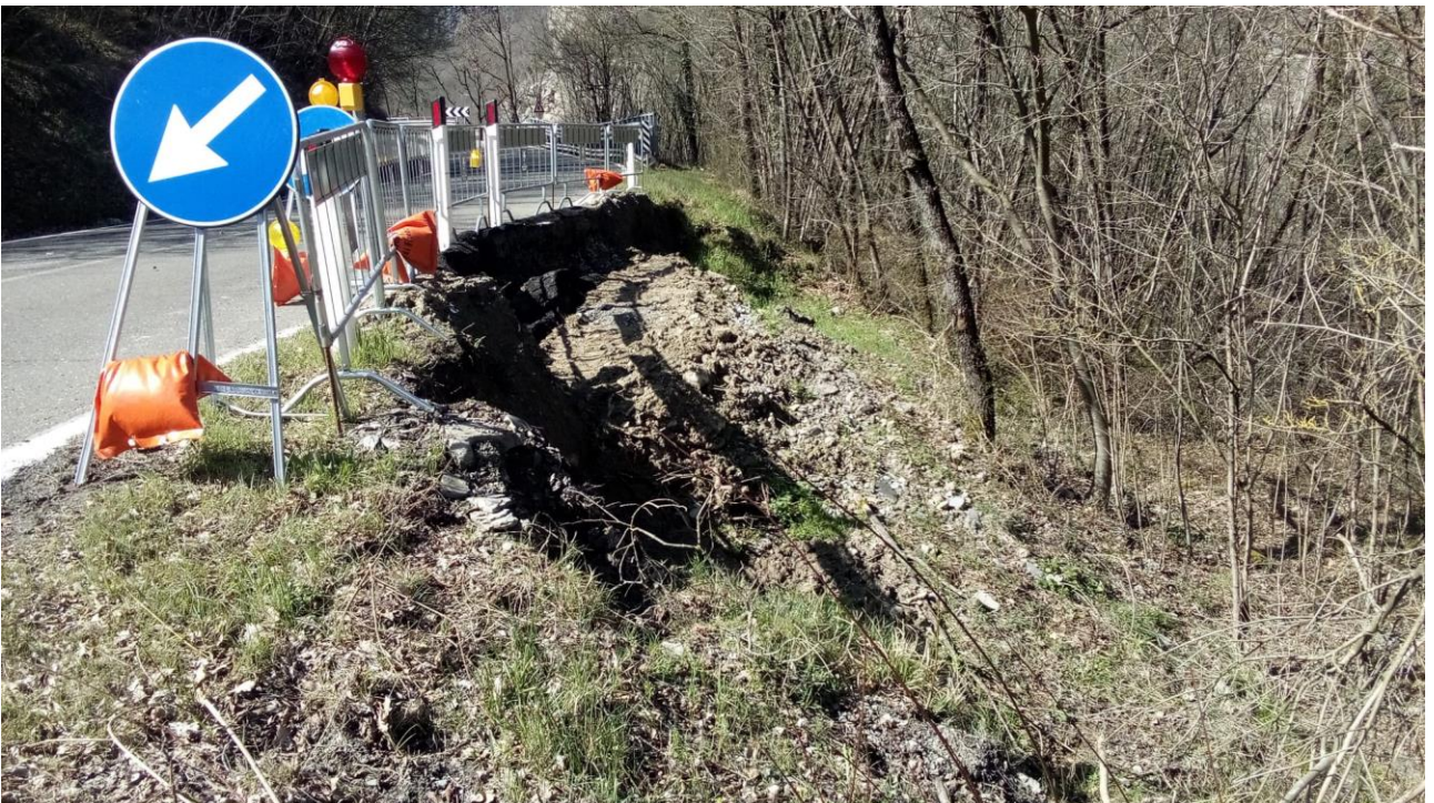
Foto 2: SP 610 km 63+800 frana di valle con danneggiamento della sede stradale