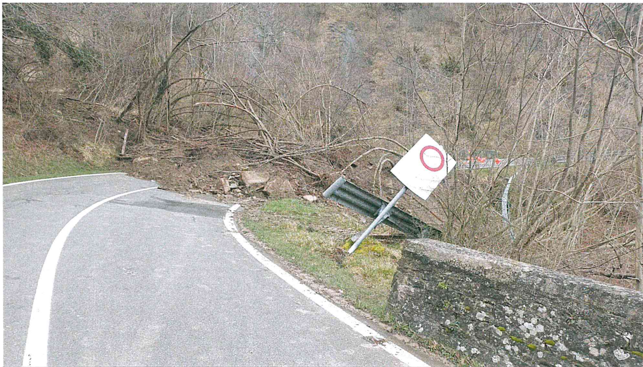
Foto 1: SP 503 materiale instabile in strada e rischio caduta massi