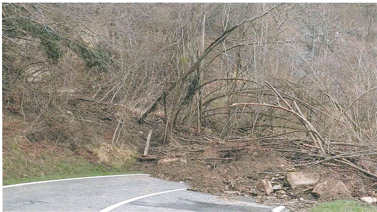
Foto 2: SP 503 materiale instabile in strada e rischio caduta massi