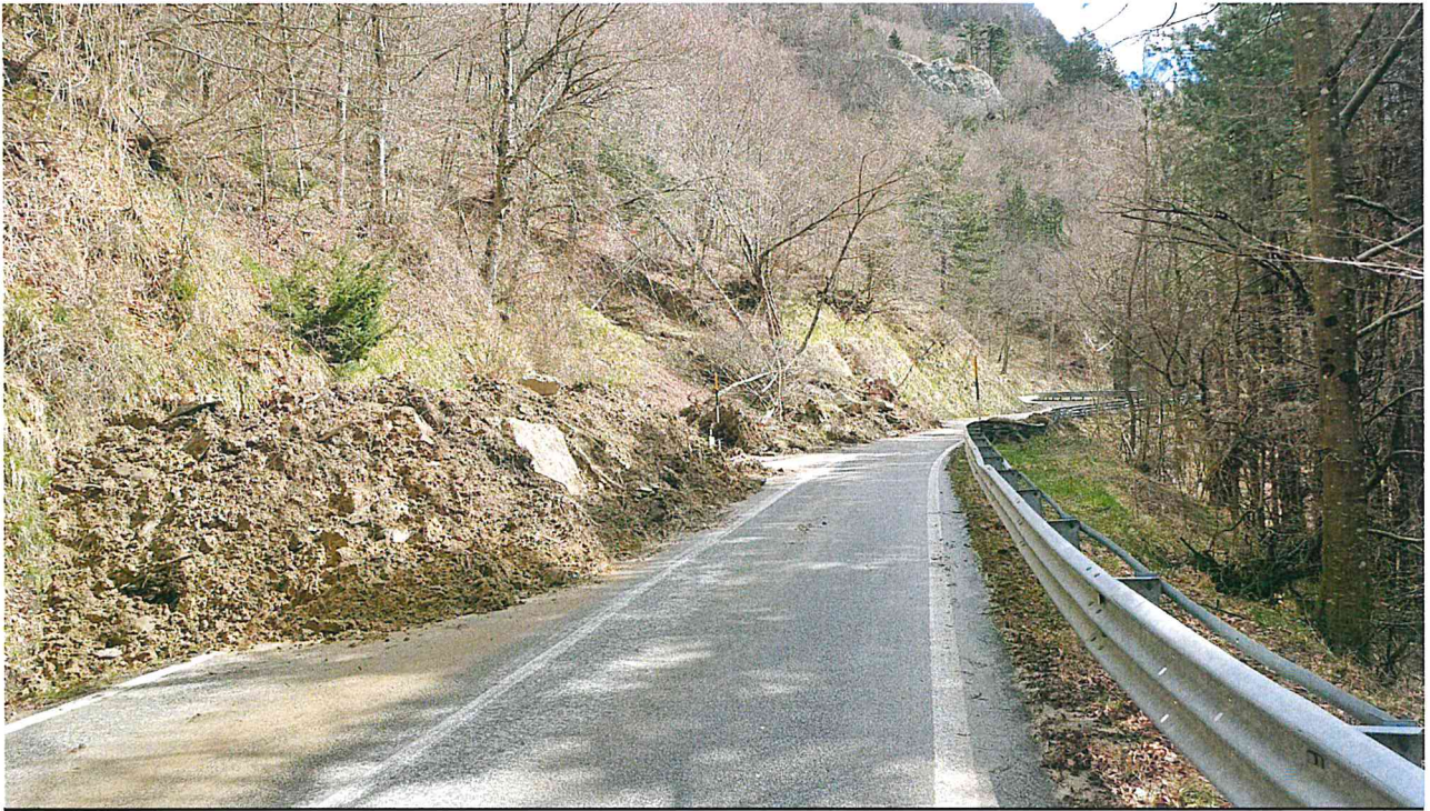
Foto 3: SR 302 materiale instabile in strada e rischio caduta massi