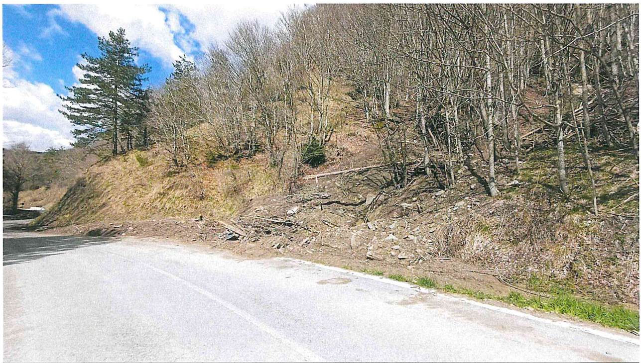
Foto 4: SR 302 materiale instabile in strada e rischio caduta massi