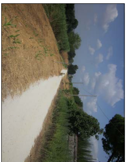
SBARCO RAMPA LATO SAN DONNINO