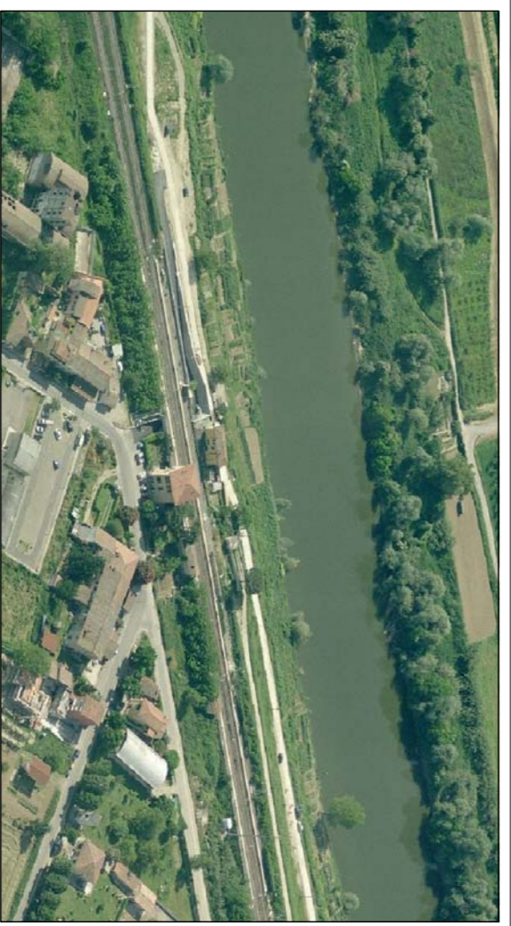
VISTA LATO STAZIONE SAN DONNINO