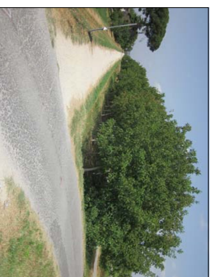
SBARCO RAMPA LATO BADIA A SETTIMO