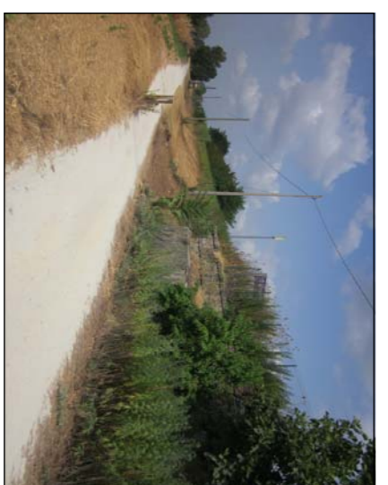
SBARCO RAMPA LATO SAN DONNINO