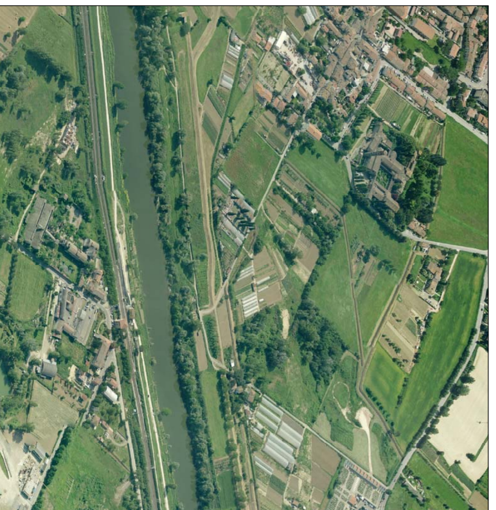
PANORAMICA BADIA A SETTIMO - SAN DONNINO