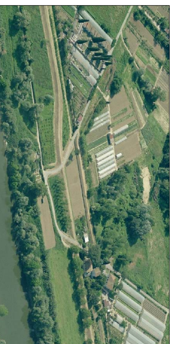
VISTA LATO BADIA A SETTIMO