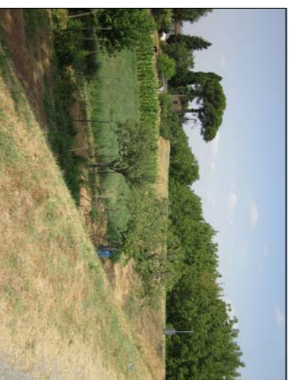
SBARCO RAMPA LATO BADIA A SETTIMO